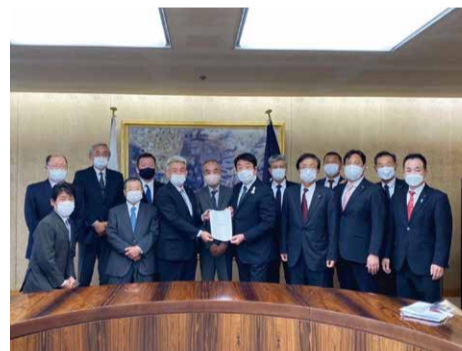
東部商工会・富士見商工会