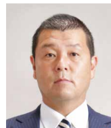
政策審議会長 すが ひろし 須賀 博史