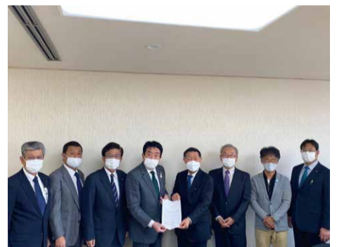
前橋デザインコミッション (MDC)